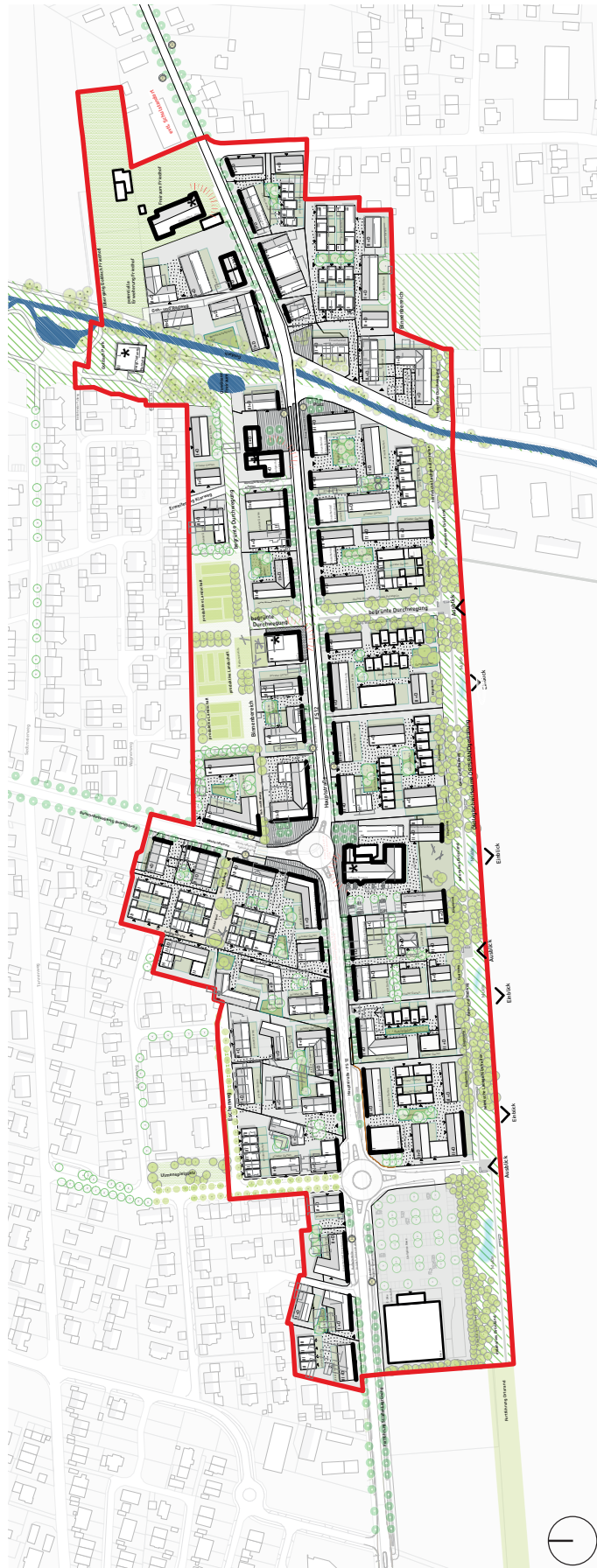
Abb. 5 // Städtebaulicher Entwurf »Zentralität Hauptstraße Goldach« // M 1:5.000 //Stand 29.05.19