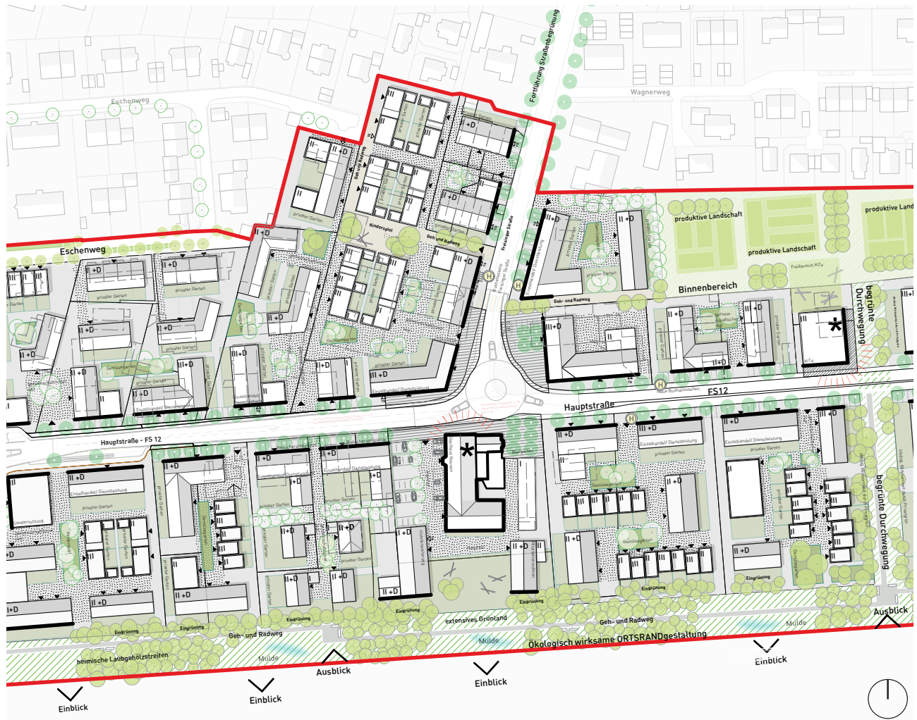
Abb. 6 // Ausschnitt Städtebaulicher Entwurf »Zentralität Hauptstraße Goldach« // M 1:2.500 // Stand 29.05.19

Der Ortsrand, der sowohl im Flächennutzungsplan als auch im Aktionsplan dargestellt ist, soll den räumlichen Abschluss der Gemeinde nach Süden bilden. Hierbei steht nicht das Abschirmen des Siedlungsgebietes durch Begrünung im Vordergrund, sondern eine Verzahnung zwischen Bebauung und freiem Feld, die einladende Ein- wie Ausblicke ermöglicht. Der Ortsrand wird als qualitativ hochwertiger Freiraum gestaltet und ist in das Geh- und Radwegenetz der Gemeinde integriert. Heimische Laubgehölzstreifen und extensives Grünland sowie Mulden prägen den Ortsrand. Er dient als ökologisch wirksamer Lebensraum für Flora und Fauna.