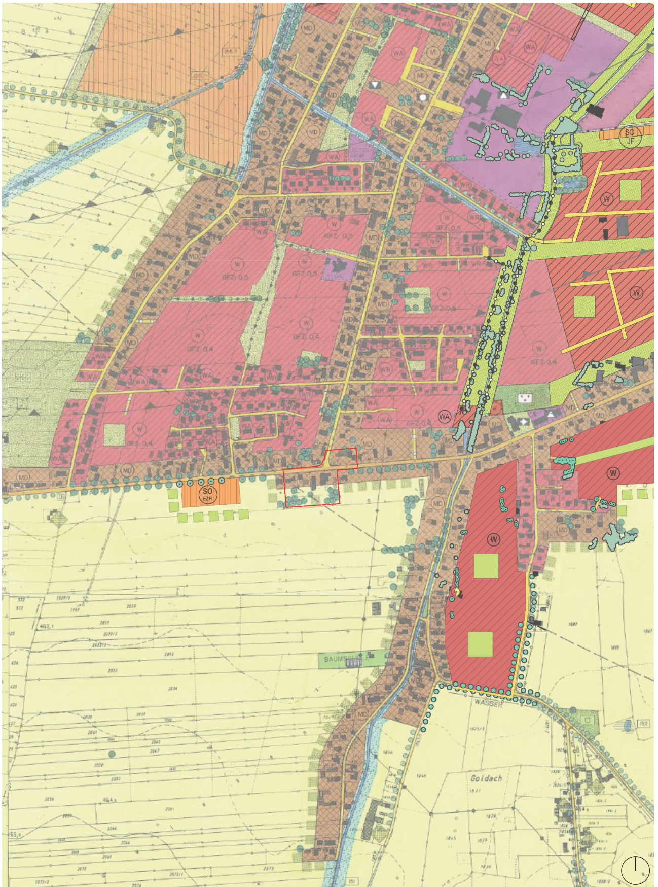
Abb. 3 // Flächennutzungsplan der Gemeinde Hallbergmoos vom 27.02.1989 in der Fassung der 5. Änderung vom 18.12.2000 einschließlich nachrichtlicher Übernahme der 6.-10. Änderung und 15.-17. Änderung inkl. Berichtigungen // Planungsstand 17.06.2019 // M 1:10.000