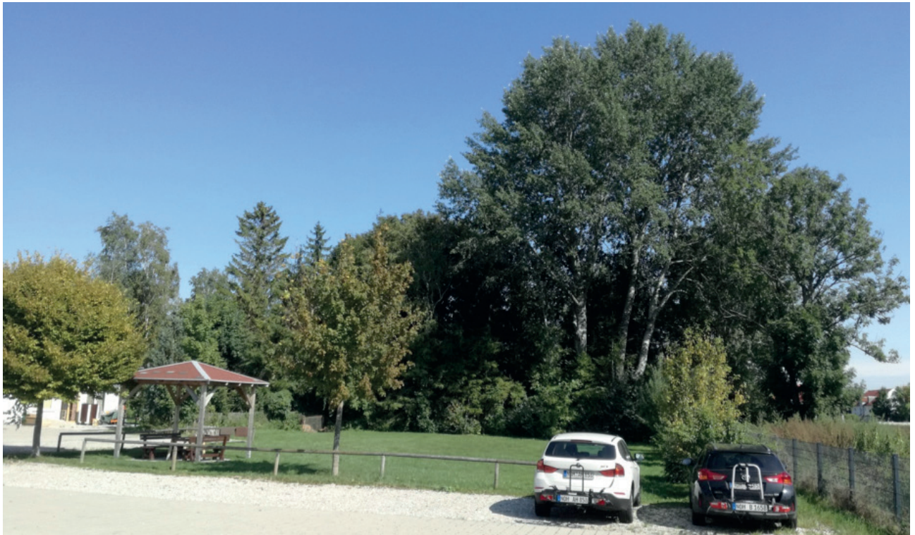
Abb. 8 // Pappeln auf dem Grundstück Fl.Nr. 2020/7

Mehlschwalben brüten. Auch für Fledermäuse sind Fortpflanzungs- und Ruhestätten an den Gebäuden und in den größeren Bäumen des Geltungsbereiches nicht völlig auszuschließen, auch wenn das diesbezügliche Potenzial meist eher gering ist (siehe hierzu Anhang 02B saP, Kap. 4.3). Bei der einmaligen Erfassung wurden Rufsequenzen einzelner Tiere des Artenpaares Weißrandfledermaus / Rauhauffledermaus aufgenommen. Ein Ausflug aus einem Quartier, ein Schwärmverhalten mit Einflug oder ein sonstiger Hinweis auf eine Quartiernutzung waren aber nicht zu beobachten. Auch wenn keine Quartiernutzung festgestellt wurde, kann dies nicht generell für den ganzen Jahresverlauf ausgeschlossen werden. Potenziell sind neben dem genannten Artenpaar auch Vorkommen weiterer Arten denkbar, vor allem Zwergfledermaus, Bartfledermaus und Großer Abendsegler.