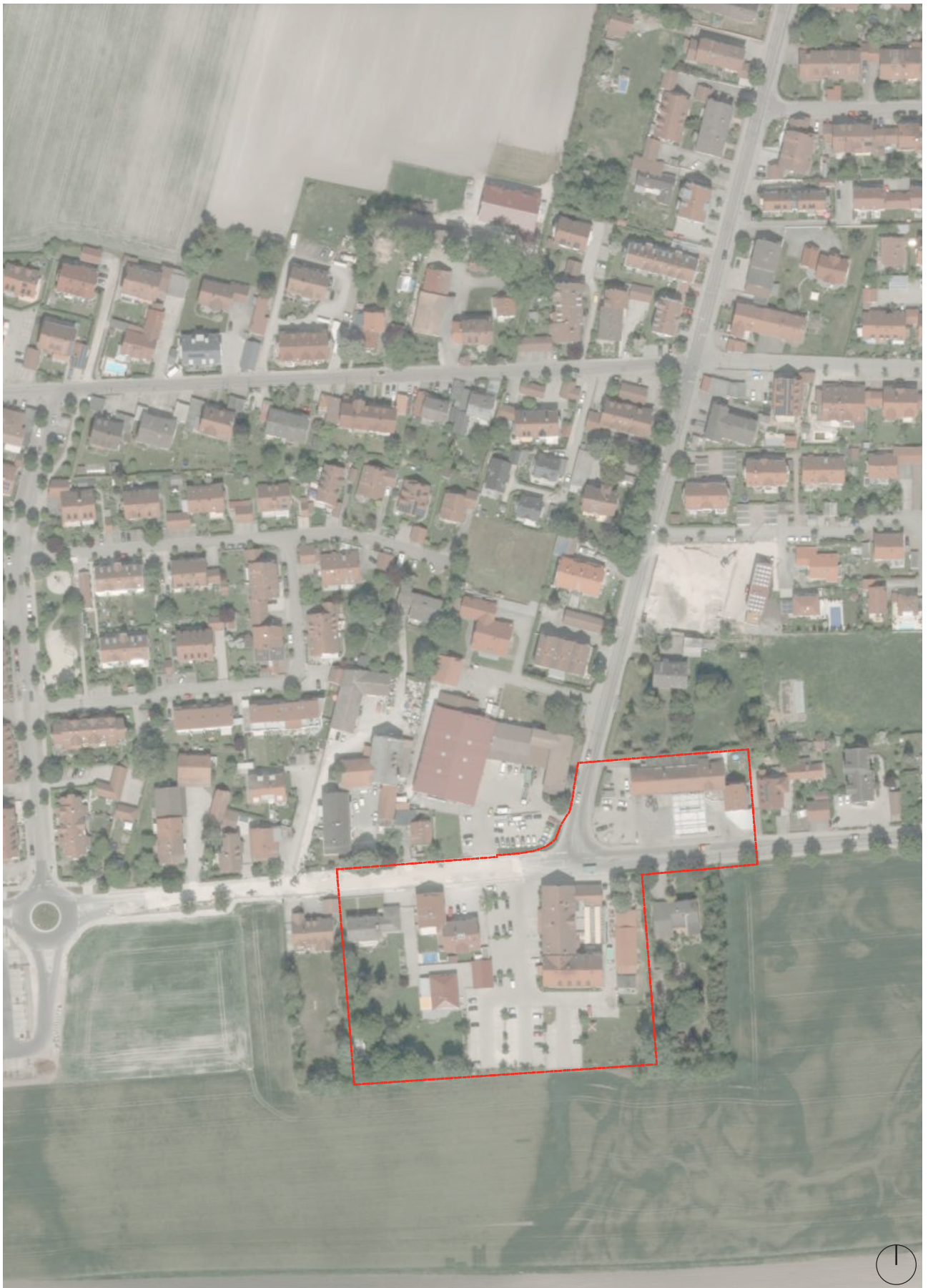
Abb. 1 // Lage des Planungsgebietes // M 1:2.500 // // Zugriff am: 24.09.2020