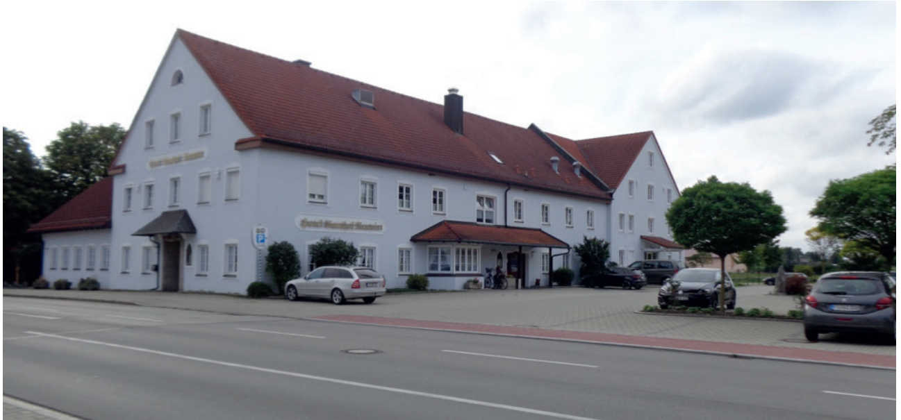
Abb. 7 // Gaststätte Neuwirt

Da im Geltungsbereich und angrenzend keine Oberflächengewässer vorhanden sind, sind Auswirkungen auf Still- oder Fließgewässer nicht gegeben. Beeinträchtigungen des Grundwassers und der Grundwasserneubildung sind durch die vorgesehenen Festsetzungen zur Versickerung und den Anschluss an die kommunale Entwässerung ausgeschlossen.